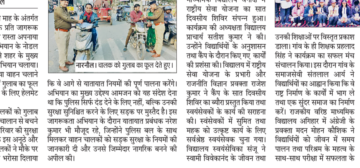
नारनौल। चालक को गुलाब का फूल देते हुए।