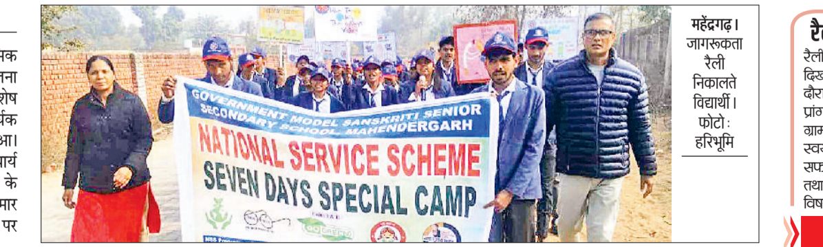
महेंद्रगढ़। जागरूकता रैली निकालते विद्यार्थी।