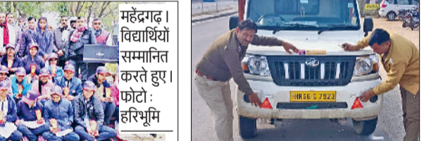
महेंद्रगढ़। विद्यार्थियों सम्मानित करते हुए।