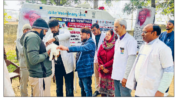
कनीना। शिविर में उपस्थित पशुपालन विभाग के चिकित्सक एवं नपा चेरपरसन।