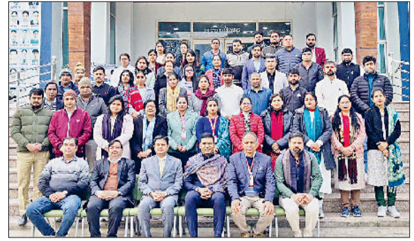
नारनौल। कार्यालय में आए लोग।